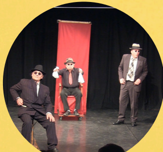
Par la Compagnie Les Trois Clous