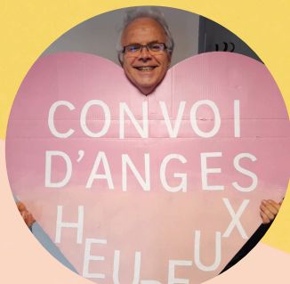
Par la Compagnie A Tour de Rôle