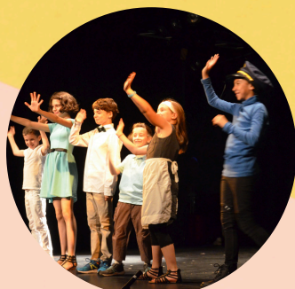
Par la Compagnie du Moulin

Tarif : 5 €, gratuit pour les – de 12 ans