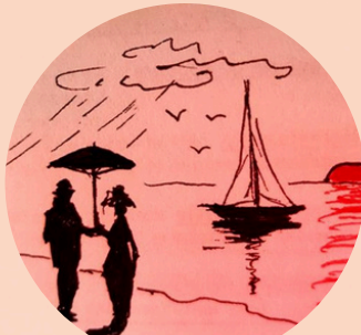
Par le Théâtre des 7 Chênes