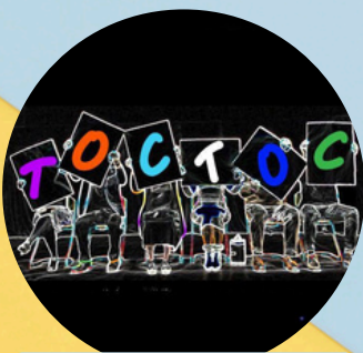
Par la Compagnie d'un soir