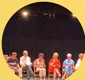
Par la Compagnie La Couleur des Mots