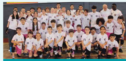
Les Licornes à Libourne lors des Challenges nationaux des catégories Mixte, Benjamin et Minime

En juillet, 8 Licornes se sont rendues en Italie lors du premier Euro junior de Dodgeball. La France a trusté la première place des 3 catégories représentées, à savoir U15, U18, et Girls. En août, 12 Licornes ont gagné l'Autriche pour le Championnat du monde de Dodgeball. L'équipe fé-