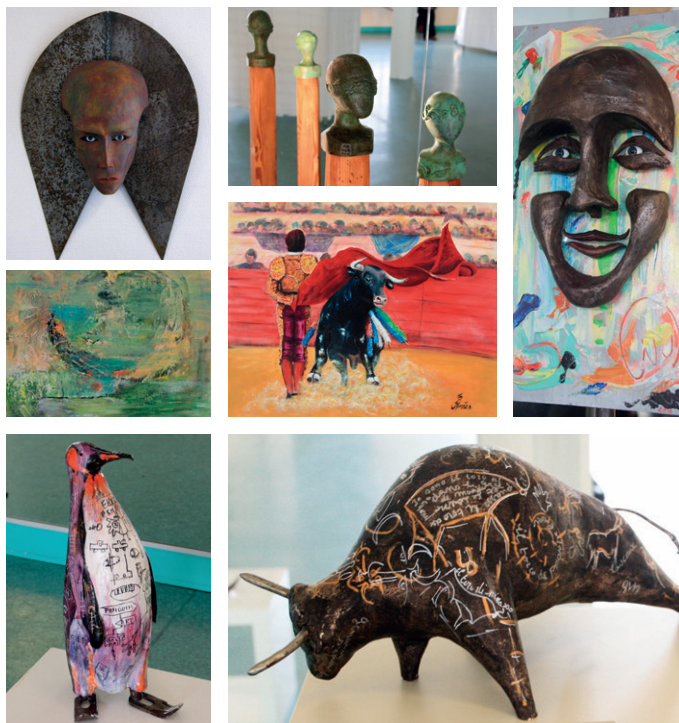
Retour sur les éditions précédentes