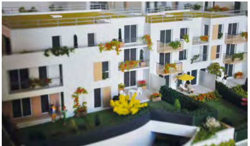
Une maquette très réaliste du projet est visible en mairie, devant le secrétariat du maire, jusqu'en septembre.

Depuis plusieurs mois déjà, la municipalité présente son projet de logements en bordure de la RN 20, le nouveau quartier "Côté Parc". On y est : cet été, les travaux de terrassement vont démarrer. Le chantier durera