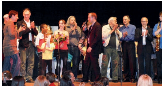
En 2011, applaudissements à la fin du spectacle !

plines, ses musiques variées, ses tours, ses performances individuelles et collectives, son humour mais également sa rigueur, fera la part belle à l'innovation musicale et chorégraphique des élèves et des professeurs. L'EMMD* Circus vous attend donc nombreux pour vous présenter sa création, avec simplicité, enthousiasme et bonne humeur. Entrée libre et gratuite.