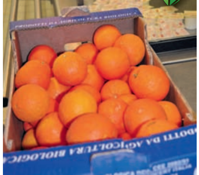
Les enfants déjeunant au restaurant scolaire découvrent le "bio" dans leurs assiettes, du 18 au 22 janvier.