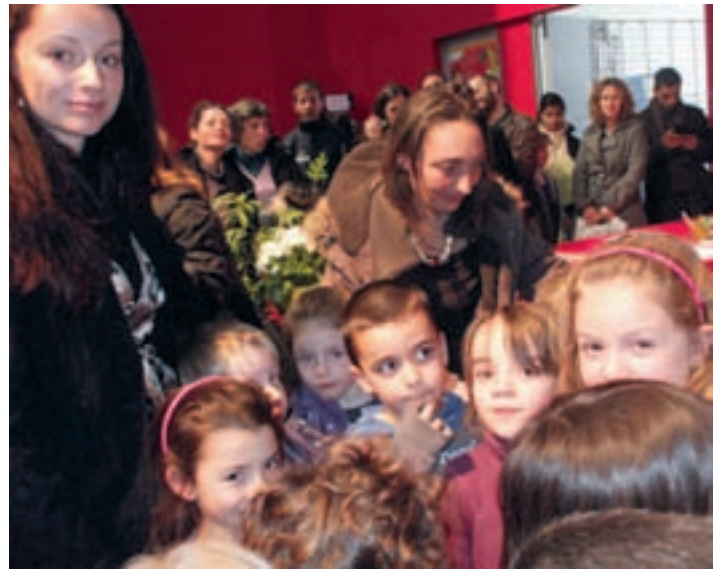
Remise du premier prix de la catégorie "réalisation en 2 ou 3 dimensions" aux maternelles de Marie Curie, le 13 mars dernier.