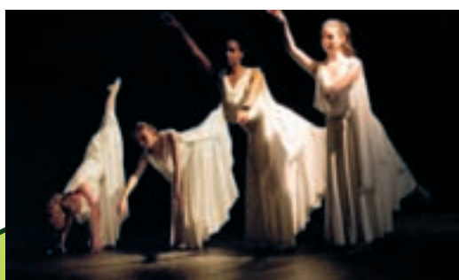
Pour clôturer la manifestation, des rencontres chorégraphiques avec, notamment, l'association "Danse et Gym du Bois".