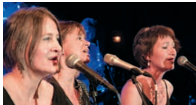
Made in Groove & Alexandra Varakine