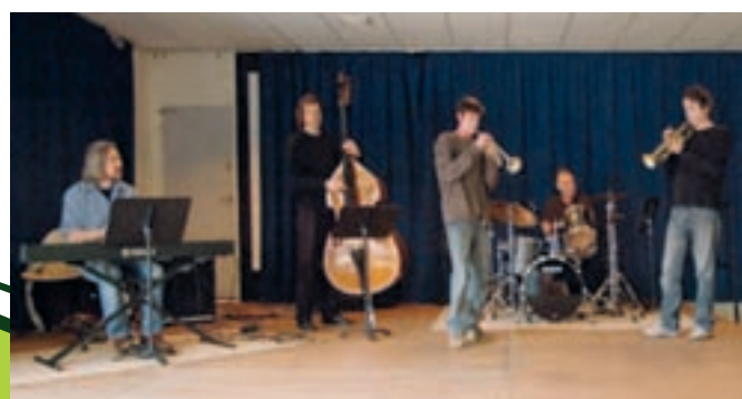
Concours ouvert aux instrumentistes à vent.