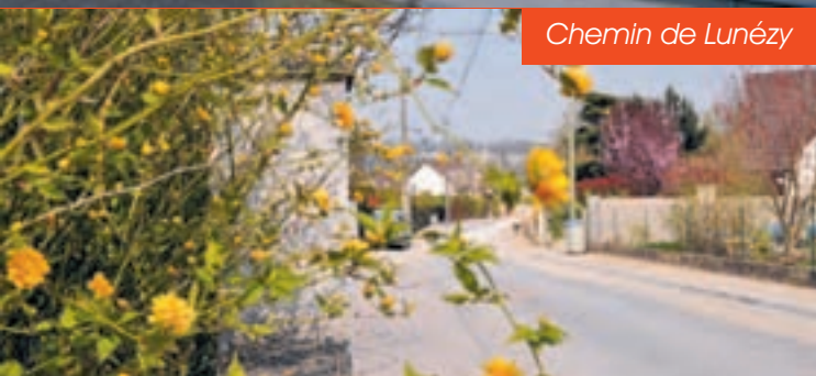
Chemin de Lunézy