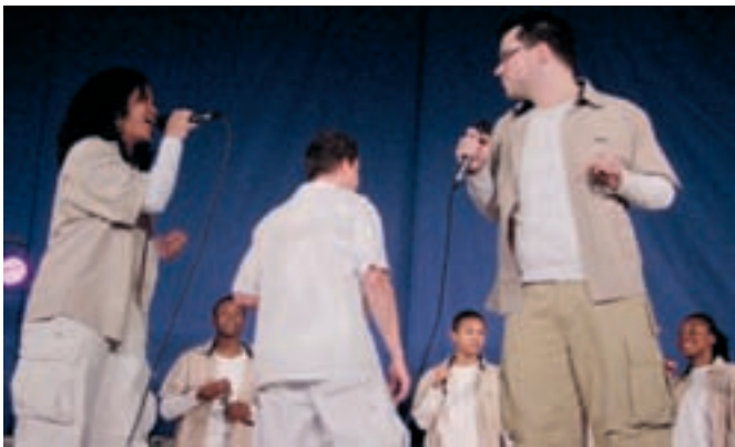
La prestation du New Gospel Family est vivement appréciée ce 14 février, jour de la Saint-Valentin !