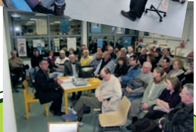
Pour fêter le 5 e centenaire de la naissance d'Ambroise Paré, la ville organise une exposition ouverte à tous, une conférence pour les adultes et des actions auprès des scolaires.