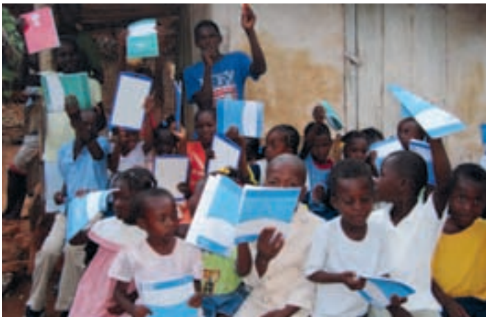
Été 2009 : remise des dons aux enfants du village de Bel-Au-Tesse, dans la commune de Pailliant