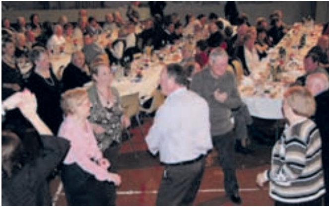
Le lendemain des vœux du Maire, fin janvier, 300 personnes de plus de 60 ans se retrouvent à l'Escale, pour marquer le début d'année.