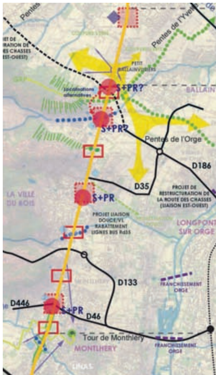
Carte de synthèse du scénario de requalification de la RN 20

Seule la partie la plus méridionale de la route est maintenue, entre le débouché de l'A66 et la frontière espagnole (décret du 5 décembre 2005). Le reste de l'ex RN 20 est déclassé et remis à chaque département respectif pour devenir une route départementale.