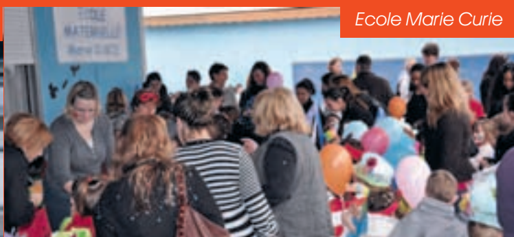
Ecole Marie Curie