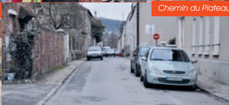
Chemin du Plateau