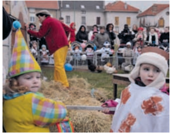
Le 12 mars, après le jeté de confettis et le défilé, rendez-vous est donné aux tout-petits place Beaulieu pour le spectacle de la Ferme de Tilligolo. Enfants, parents, professionnelles de la petite enfance et animaux sont venus nombreux !