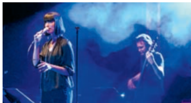
Woodtown Big Band