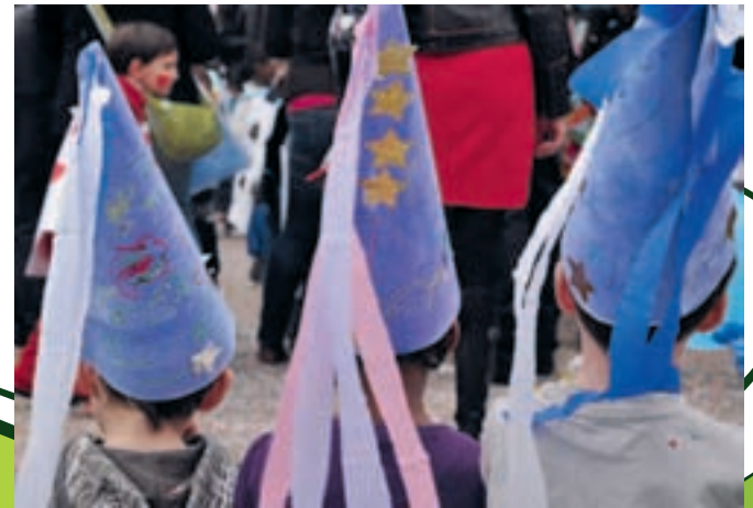
A l'école Marie Curie, en mars, on fête aussi le carnaval !