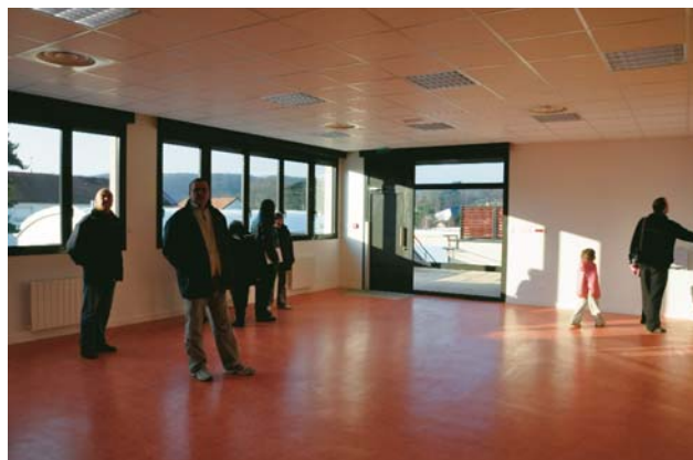
Visite de fin de chantier par les élus et le service Educatif

Dès la rentrée de janvier, une des classes migrera vers une nouvelle salle, au 1 er étage du restaurant scolaire. La salle informatique remplacera une semaine plus tard la BCD (bibliothèque centre de documentation), qui sera désormais située au rez-de-chaussée, sous le préau.