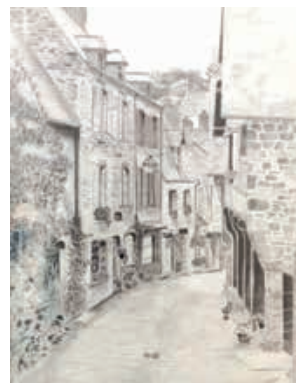
Prix Dessin : Noëlle Peudupin-Choichillon

Voici les réalisations urbisylvaines primées.